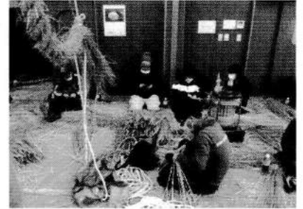
2月の藁スグリ、綱繰り作業