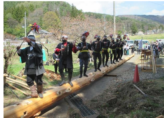
第四位 やまと式～綱渡り式

両日共約80名の参加で執り行われました。来年の建立祭が盛大に実施できるように全員で祈願しました。