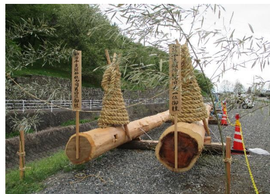
弘法山下に2本の御柱がお休みしています。