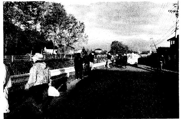
町会一斉清掃の様子